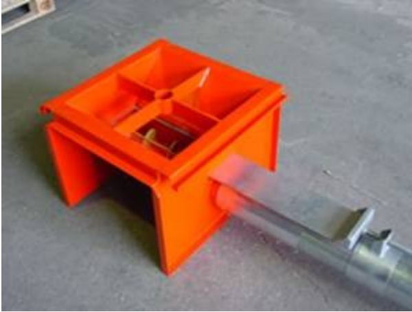
Dodatni ulaznik sa regulatorom i šiberom (sprečava nekontrolisani unos materijala)