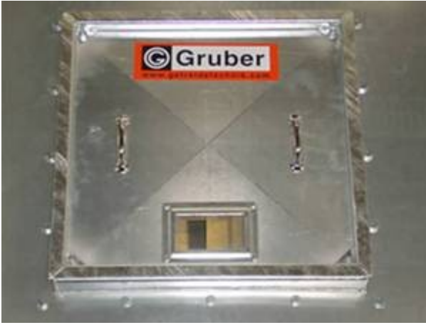
Ulazna vrata u silos