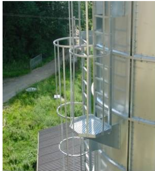
Stabilne lestve za penjanje na silos sa odmorištem