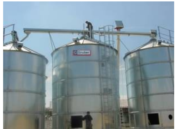
3 spoljašnja silosa GWSA 5,25/6 zapremine po 162 m 3