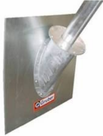
Nastavak sa transporterom za pražnjenje silosa na gornjem nivou (silosi sa konusom)