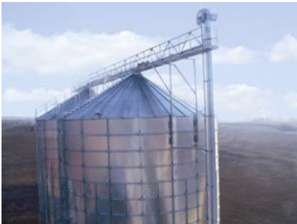
2 spoljašnja silosa GWSA 15/14 zapremine po 3100 m 3