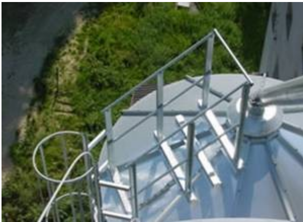
Krovni ulazni otvor sa krovnim mostom