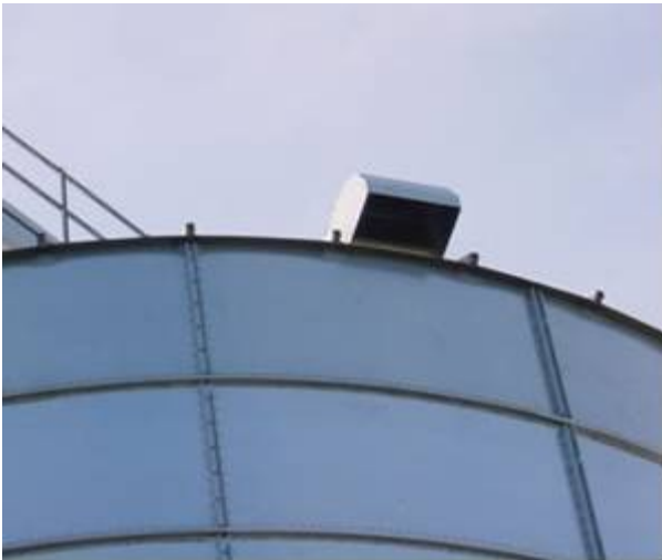
Ventilator na silosu