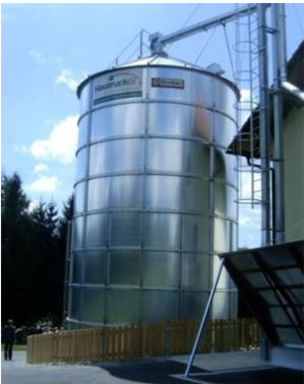
Spoljašnji silos GWSA 6/10 zapremine 348 m 3