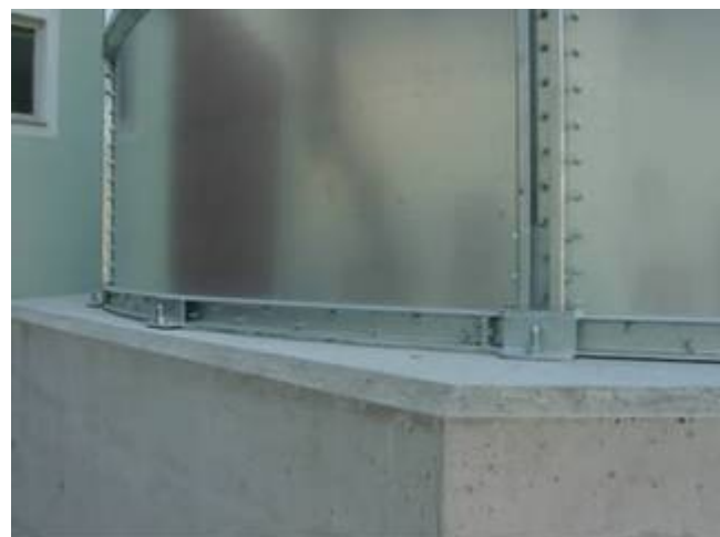
Betonski fundament za silos