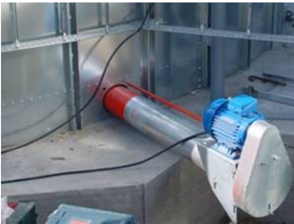
Transporter za praznjenje na donjem nivou (silosi bez konusa)