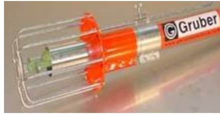
Izlaznik sa zaštitnom korpom