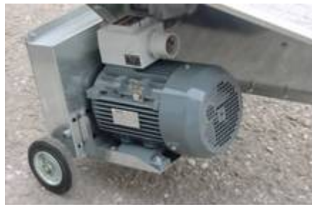
Motor, kompletan, montiran