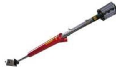
Pužni transporter KS sa ugrađenim prečišćaćem