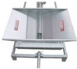
KK sa usipnim košem dimenzija 1133mm x 3 košem dimenzija 1 x 2m