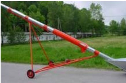
Noseći ram za pužne transportere sa usipnim košem, i prečišćaćem