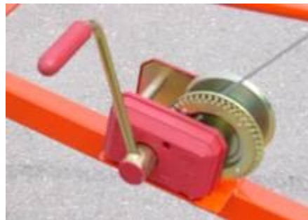
Ručna regulacija visine nosećeg rama