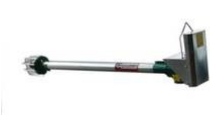
Pužni transporter KS